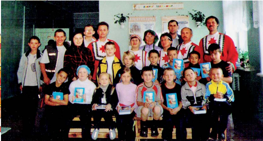
Inkrez-musiikkiryhmäläiset kouluvierailulla v. 2009.