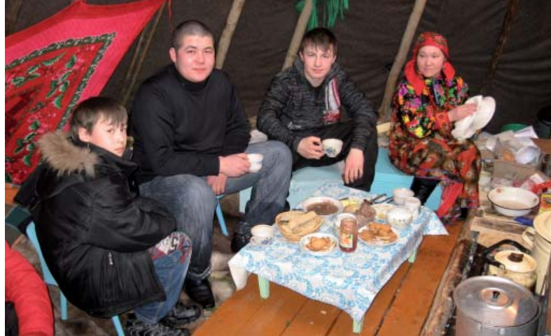
Teetauko hantijurtassa.

Hantiuskovien mielestä äänitetyt Raamatun kertomukset ovat mainio tapa välittää ihmisille Jumalan sanaa, etenkin nyt, kun tekstejä voi ladata pikkuruisiin mp3-soittimiin. Tulitikkulaatikon kokoista soitinta voi vaikkapa poropaimen kuljettaa taskusaan ja kuunnella taigalla laumaa hoitaessaan, soitin välittää sanoman jurtassa, jossa lukemiseen ei aina riitä valoa. Myös lapset ja nuoret ovat kiinnostuneita äänitteistä.